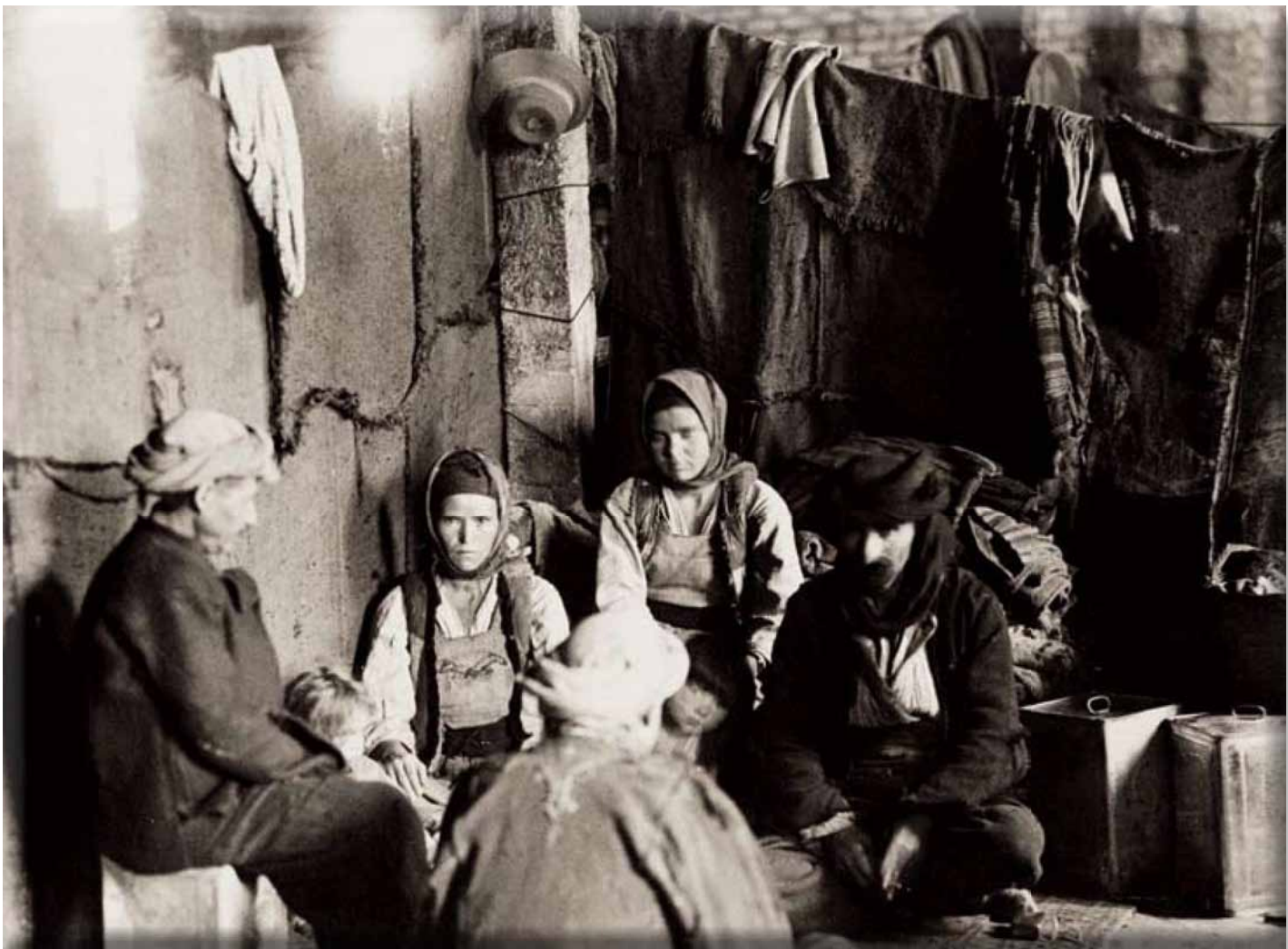
Προσφυγική οικογένεια (1923).

Με την έννοια αυτή, η ανταλλαγή και αποκατάσταση των προσφύγων θα παρείχε, πρώτα - πρώτα, κρατική και διεθνή προστασία στους ξεριζωμένους της Ανατολής. Ήταν όμως και ενέργεια εθνική, με την έννοια ότι θα εξυπηρετούσε ομοεθνείς πληθυσμούς και όχι ότι θα ενισχύονταν εθνικά οι βόρειες περιοχές της χώρας, αφού ήδη ο μεγαλύτερος όγκος των προσφύγων (κάπου 1.150.000 άτομα) κατέκλυσε την Ελλάδα (κυρίως τη Μακεδονία), πριν προετοιμαστούν και πάρουν μέτρα οι ελληνικές κυβερνήσεις. Εντελώς ξαφνικά και αναπάντεχα.